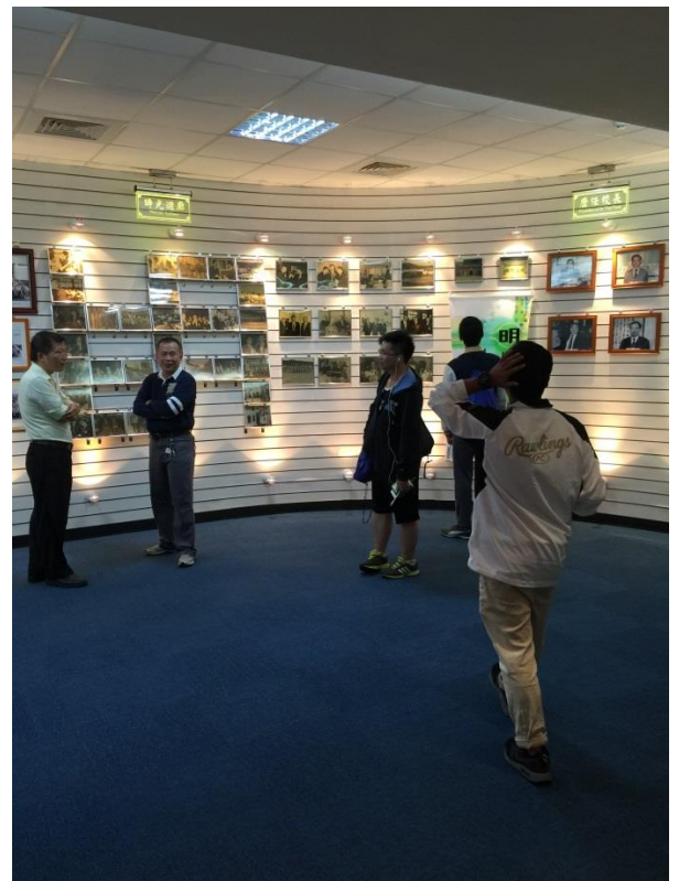
師生一同參觀校史室