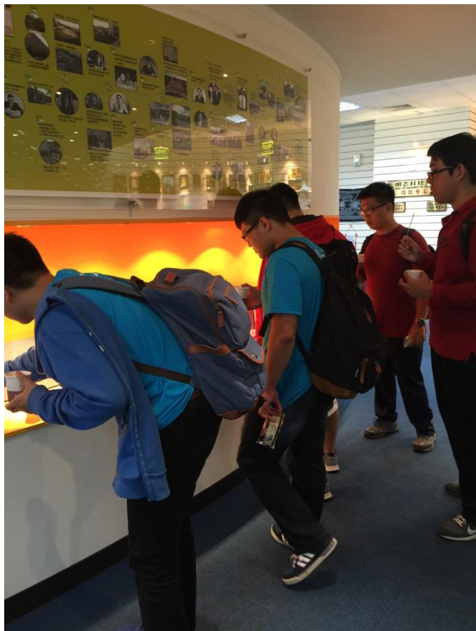
同學們翻閱歷屆畢業紀念冊