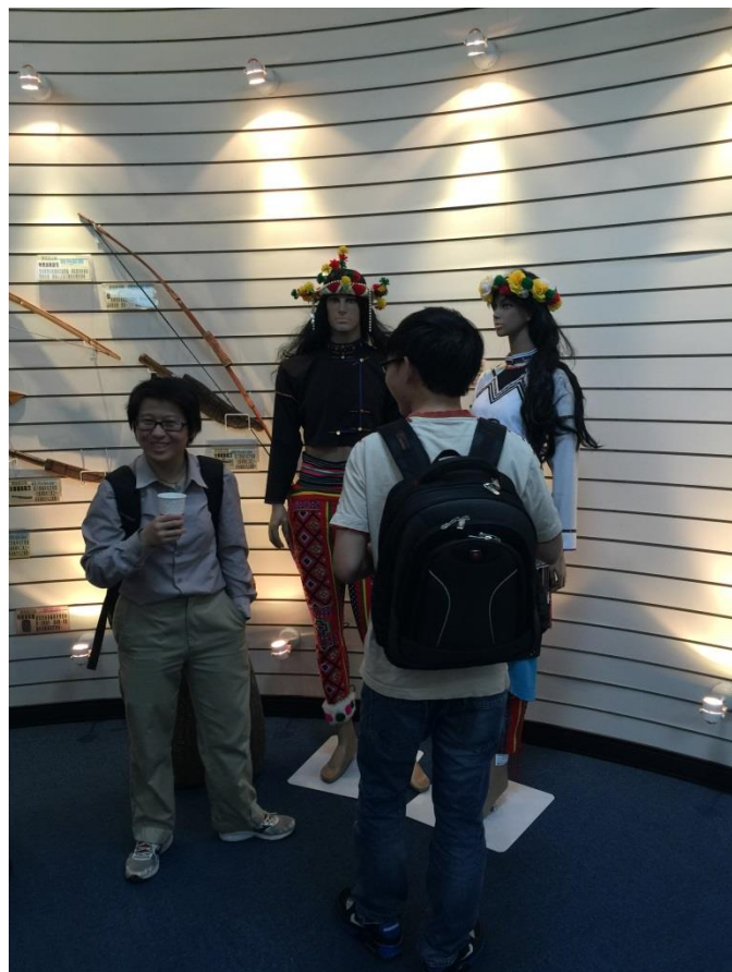
TA 助理為越籍同學講解原民文化